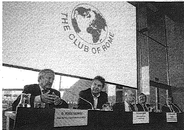
Experiencias > El CaixaForum acogió el foro del Club de Roma.